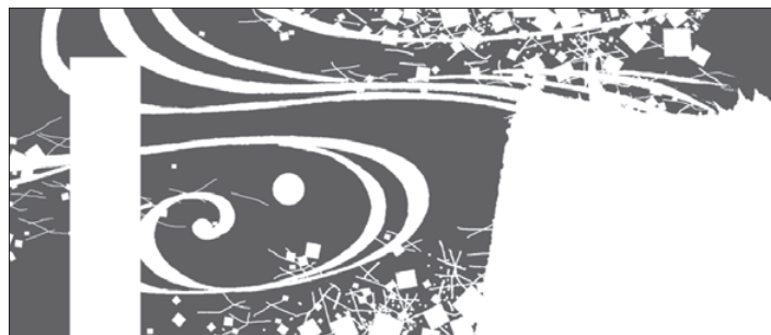
[エンボス版] 地紋部分

写真や帯などに使用する場合とは違うインパクトがあり、特に、濃色上の地紋は見応えを与えます。