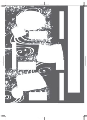
[エンボス版] 疑似エンボス部分が75%の データを作成します。

疑似エンボスで艶を押しさえた分、グロスを適用した部分がさらに強調され、目を引き、インパクトを与えます。